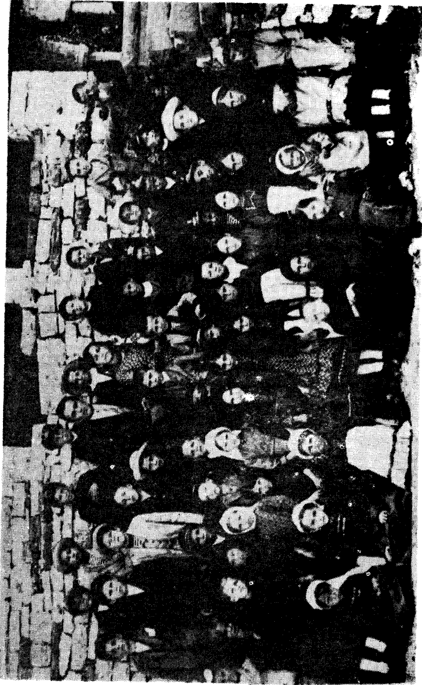
Η φωτογραφία είναι τραγμένη το καλοκαίρι του 1931 στις εξετάσεις.